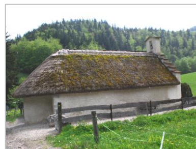
La chapelle de Trésanne