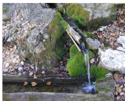
La source de la Chanas