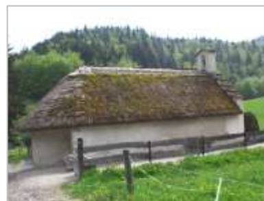
La chapelle de Trésanne