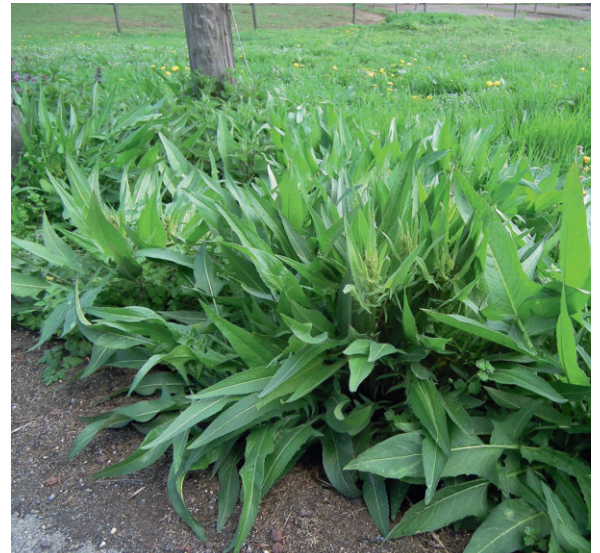
Port- B. orientalis